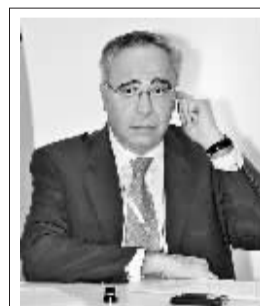
克劳特·斯马亚 (Claude Smadja)

斯马亚:在过去的几年中,“中国声音”在国际经济论坛或会议上的参与度和重要性都得到了显著的提升。即使回到10年前,